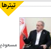
مسعود پزشکیان :